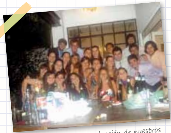
Previa de la fiesta de graduación de nuestros compañeros. 2010

Dejarán de escuchar nuestros gritos por los pasillos y en las aulas. Faltarán los aplausos que siempre se oían a mitad de cualquier clase festejando algún comentario oportuno. Y ya no seremos en el IUNIR el año más criticado y elogiado por profesores en las reuniones de claustro.