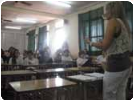
• Charla sobre adicciones en el Colegio del Sol