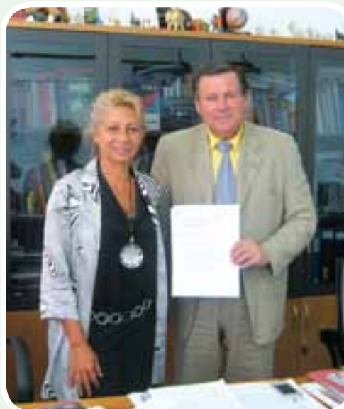
• Firma convenio específico Dec. Med. Univ. L-AQUILA y Rector IUNIR