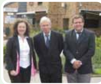
• Responsable de Relaciones Internacionales de UCL, Decano de Medicina UCL y Rector IUNIR