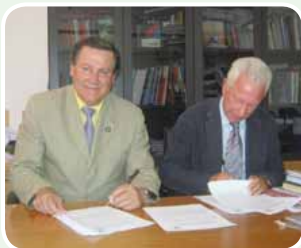
• Firma Convenio marco Univ. de L'AQUILA - Italia