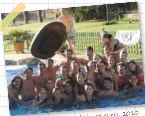
Día de sol, pileta y asado junto al río. 2010