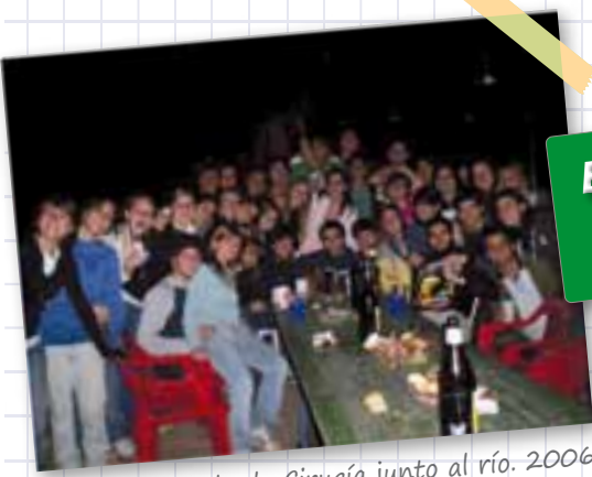
Asado de Cirugía junto al río. 2006

Acá estamos hoy.. Un grupo que supo alimentar cotidianamente el vínculo de la amistad y el compañerismo... Aquí, algunas imágenes que hablan por nosotros.