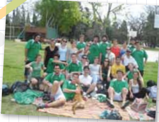
Jornada deportiva del día del estudiante

Acá estamos hoy.. Un grupo que supo alimentar cotidianamente el vínculo de la amistad y el compañerismo... Aquí, algunas imágenes que hablan por nosotros.