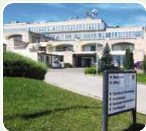
• Universidad de L-AQUILA Rectorado

demostraron un especial interés en fomentar las relaciones internacionales entre la Universidad del L'Aquila y nuestra Institución para fortalecer no sólo los términos de intercambios estudiantiles, sino también el reconocimiento recíproco de Títulos a futuro.