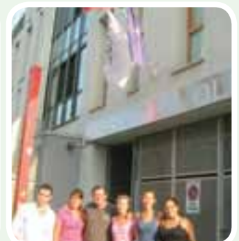
• Residencia Estudiantil Olimpia (Torino)