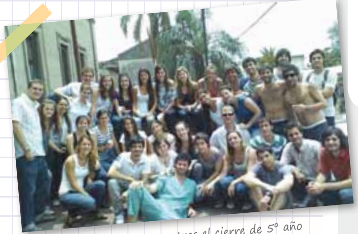
Choripaneada en la terraza tras el cierre de 5º año