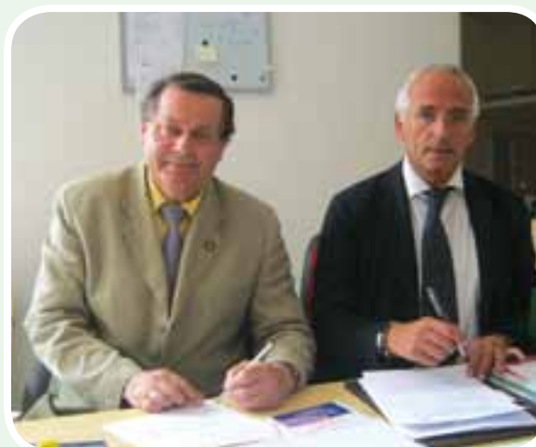
•Firma Convenio Espec. Dec. Carrera Odontología Univ. L'AQUILA CONVENIO