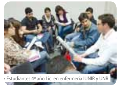
• Estudiantes 4º año Lic. en enfermería IUNIR y UNR

profesional común. Estuvieron presentes las autoridades de ambas instituciones y prestigiosos profesionales del CUDAIQ, permitiendo que las jornadas se desarrollaran con total éxito y en un ámbito de cordialidad y compañerismo.