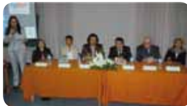
• Autoridades y docentes IUNIR y UNR